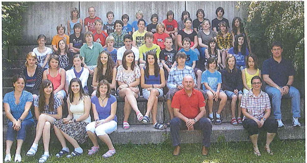
Foto: Die große Zahl der Gaminger Schwimmtalente mit den SportlehrerInnen.

Ein großer Dank gilt auch den SportlehrerInnen, die die jungen Menschen gut vorbereitet und immer wieder motiviert haben.