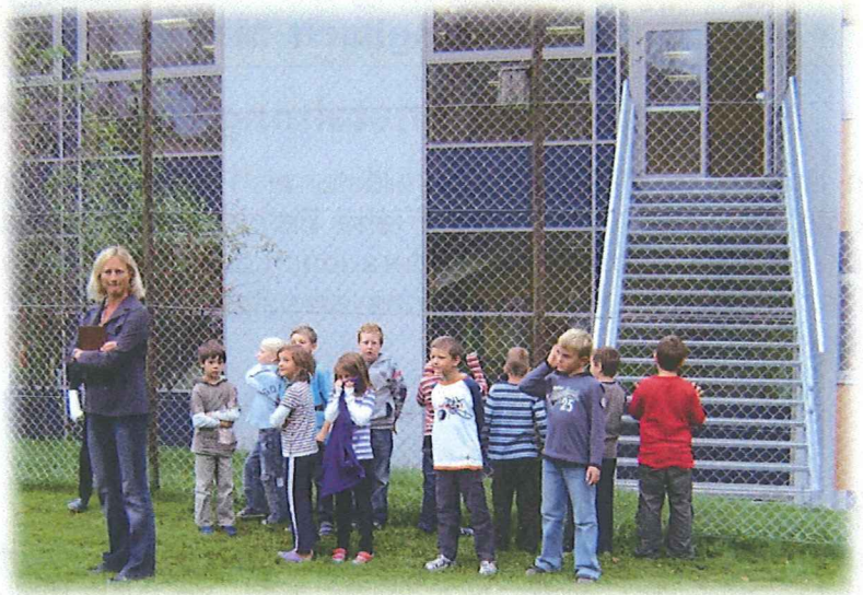
die Evakuierung über den neuen Fluchtweg der sanierten VS Gaming funktionierte sehr gut. Damit es jedoch im Ernstfall zu keinen Verzögerungen kommt wird der Zaun zum Sportplatz in Fluchtrichtung geöffnet.