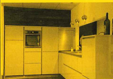
Modell Gala, Hochglanz Lack, APL Keramik, ohne E-Geräte, Spüle, Armatur