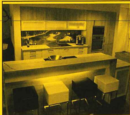
Modell Nova, Eiche Stein/weiß mit Bar, ohne E-Geräte, Spüle, Armatur und Hocker