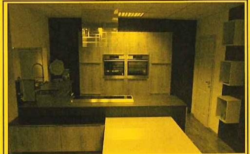
Modell Bari-Nova, Asteiche sägerauh/lavaschwarz, ohne Steinplatte, Armatur und E-Geräte